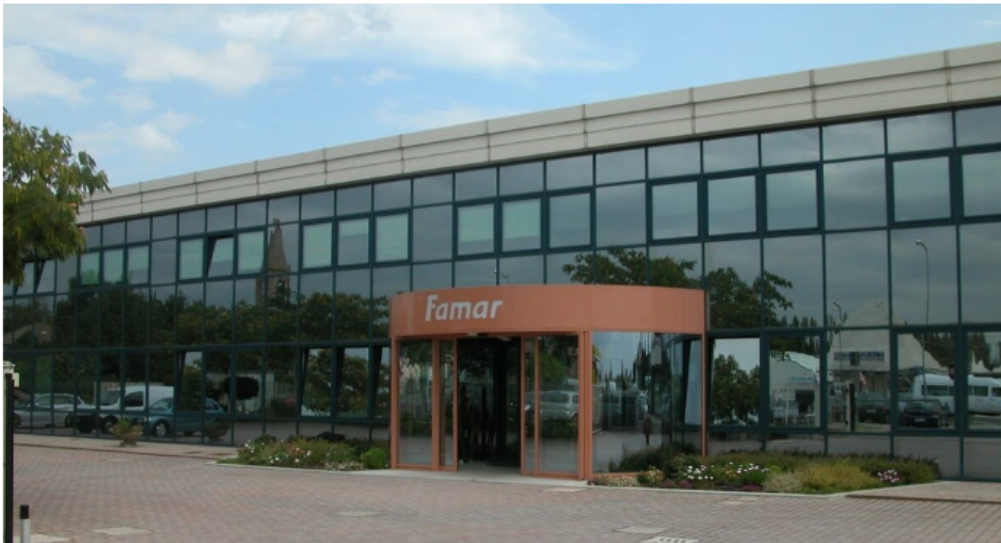
Famar dispose d'un site de production de 6.000 mètres carrés à Ferrare, en Italie. - Hind

Holding Industriale (Hind SpA) renforce son périmètre avec l'acquisition de Famar Srl. La société d'investissement italienne a finalisé l'opération via sa filiale Holding Moda, qui a pris la majorité du capital de cette entreprise italienne spécialisée dans le développement et la production d'habillement pour femme et homme 100% made in Italy , s'adressant aux marques haut de gamme.