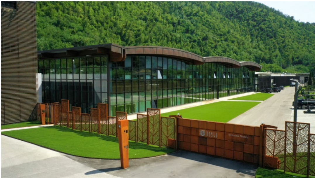
Beste affiche un chiffre d'affaires de 48 millions d'euros