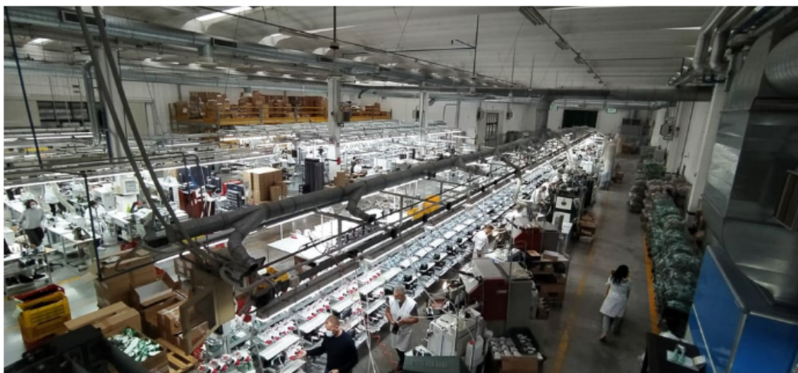
L'usine de chaussures - Valmor

Après la maille, le jersey, le prêt-à-porter féminin, la maroquinerie et le denim, Holding Industriale (Hind SpA) entre dans le secteur de la chaussure en investissant dans Valmor Srl. La société d'investissement italienne a finalisé l'opération via sa filiale Holding Moda, qui a pris 50% de cette entreprise transalpine spécialisée dans la production et la distribution de sneakers pour des marques de luxe. Le montant de la transaction n'a pas été divulgué.