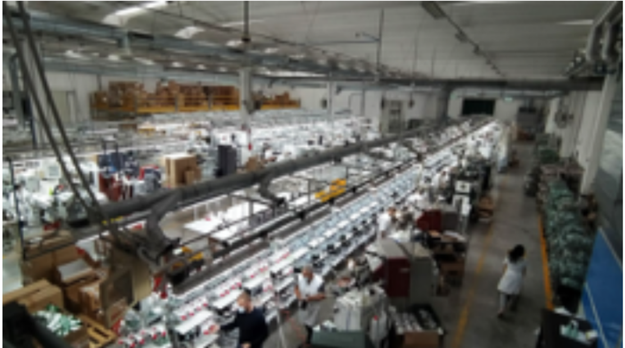
Inside the Valmor plant

MILAN — Preserving and investing in Italy's manufacturing pipeline continues to be a key M&A element as the year winds down with yet another transaction that sees Holding Industriale (Hind) taking a 50 percent stake in footwear specialist Valmor Srl through its controlled firm Holding Moda.