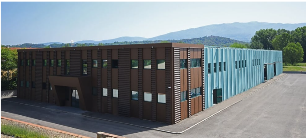
Le spécialiste de la sérigraphie est implanté en Toscane - Seriscreen

Les grandes manœuvres se poursuivent dans la filière du made in Italy . Après l'annonce de l'investissement de LVMH dans deux manufactures spécialisées dans le cuir et les peaux exotiques , c'est au tour de Holding Industriale (Hind) de se renforcer, via une dixième acquisition dans la mode. Alors qu' elle a racheté le spécialiste de la broderie Rilievi Group début septembre , la société d'investissement italienne vient de prendre dans la foulée, via sa filiale Holding Moda, la majorité de l'entreprise toscane Seriscreen, imprimeur sur tissu et sur cuir travaillant pour les principales maisons de luxe. Le montant de l'opération n'a pas été rendu public.