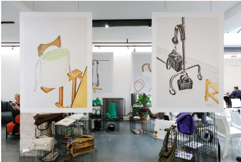
Le showroom parisien de Holding Moda

Holding Industriale (Hind) pose un premier jalon en France. Via sa branche Holding Moda, qui agrège autour d'elle sept entreprises transalpines, chacune spécialisée dans une catégorie de produit, l'investisseur italien a construit depuis 2018 un pôle industriel d'excellence dans le secteur du luxe, pesant 125 millions d'euros de chiffre d'affaires et employant plus de 400 personnes. Pour resserrer ses liens avec ses principaux clients, à savoir les maisons françaises, et mieux faire connaître son offre, il vient d'inaugurer un showroom à Paris, au cœur du Marais, situé au 26, rue des Rosiers.